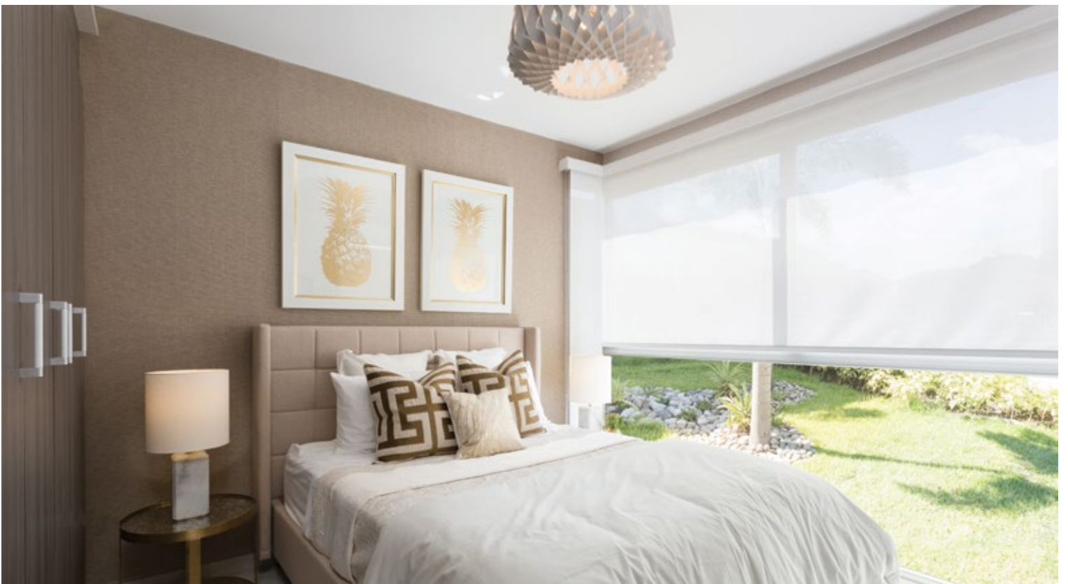
Galeria Towers & Plaza | Recámara principal