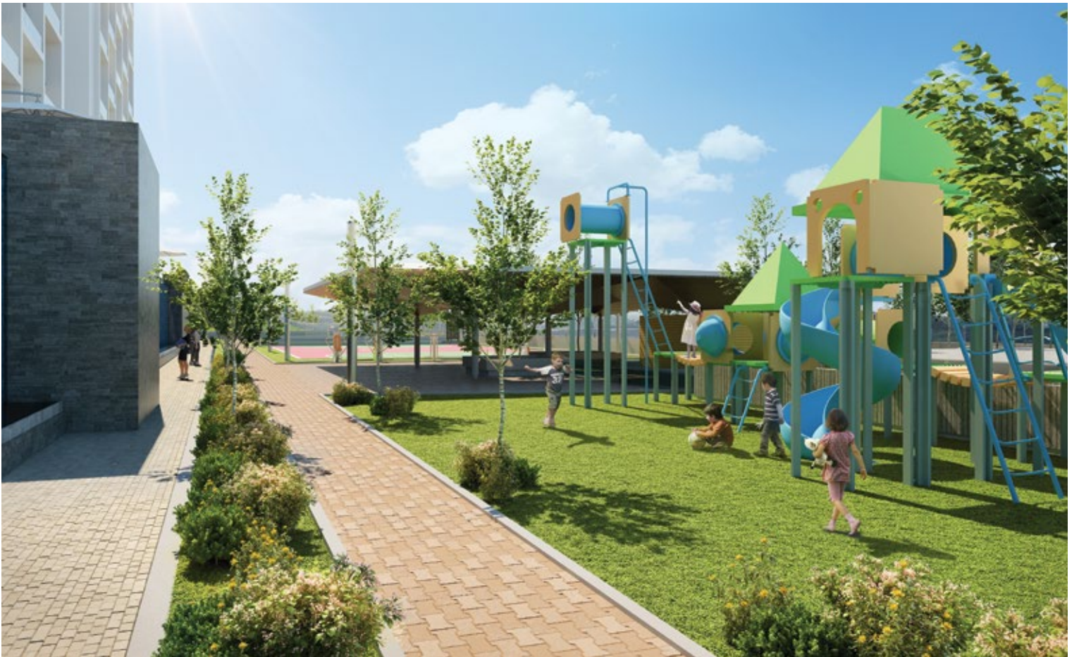
Galeria Towers & Plaza | Áreas sociales