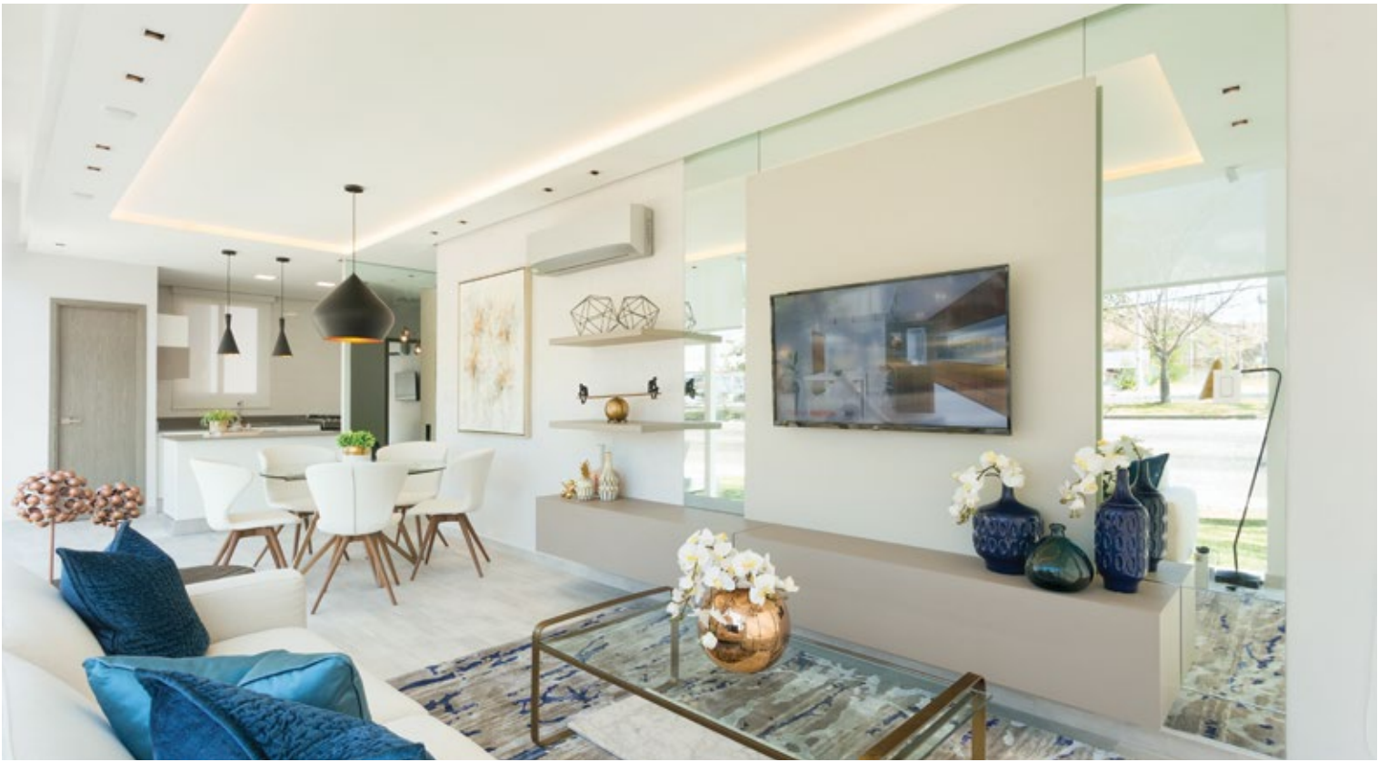
Galeria Towers & Plaza | Sala-Comedor